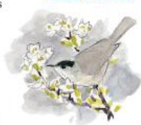
Fauvette à tête noire

Ce bois est fermé au public mais l'observation de sa lisière offre toujours des surprises. On quitte ici le monde marin et, à certains endroits, les vagues ne sont même plus entendues. Au printemps, le chant de la fauvette à tête noire retentit. Les jonquilles sauvages semblent s'être échappées du bois pour égayer la prairie. Ne les cueillez pas, laissez tous les visiteurs profiter de leur présence. Remarquez à partir des hauteurs les différentes couleurs qu'offre le massif boisé, en fonction des différentes espèces. Les pruneliers forment une haie derrière laquelle d'autres espèces plus sensibles au vent peuvent se développer.