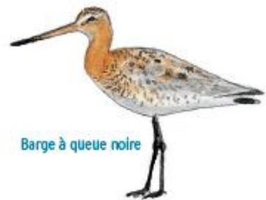
Barge à queue noire

Une réserve de chasse a été mise en place au nord de la baie de Somme dès 1968. Étendu en 1973, cet ensemble protégé a été élevé au rang de Réserve naturelle nationale, en y intégrant le Parc ornithologique du Marquenterre en 1994. De là, la confusion entre parc et réserve, mais l'essentiel est que la baie de Somme dispose avec ces deux entités d'une surface protégée très efficace, et d'un site permettant la contiguïté entre les hommes et les oiseaux. La protection n'est pas ici une mise sous cloche. Les activités de pêche s'exercent sur l'estran de la même façon que sur le reste de la baie de Somme. En dehors du Parc, les visiteurs sont sensibilisés afin de pouvoir se promener sans déranger.